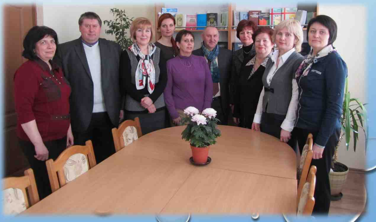
Первые члены клуба истории фармации. 2014 год