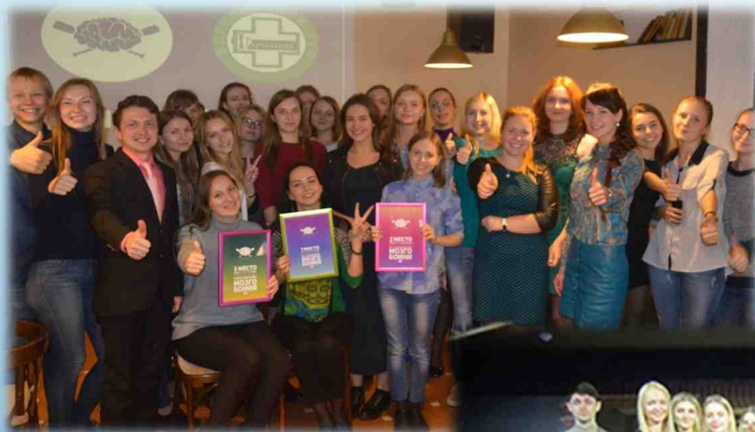
День молодого специалиста в Могилевском РУП «Фармация». 2017 год