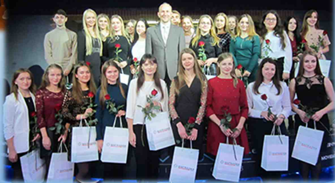
День молодого специалиста в Гродненском РУП «Фармация». 2019 год