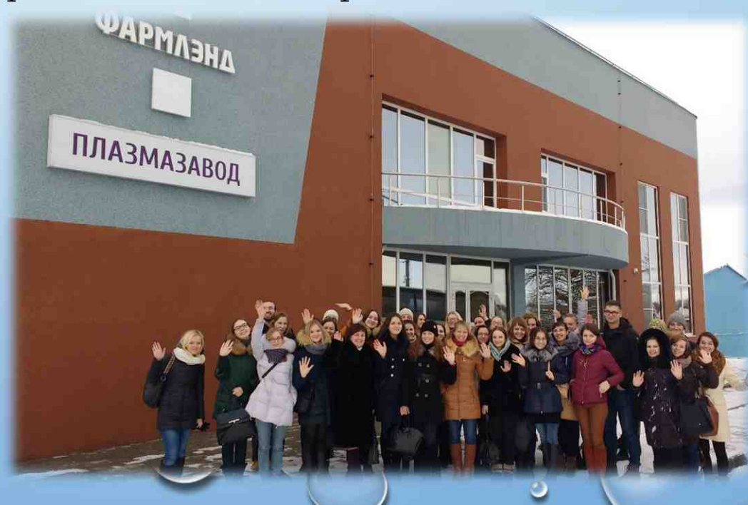
Посещение СП ОО «Фармлэнд» провизорами-интернами РУП «БЕЛФАРМАЦИЯ». 2016 год