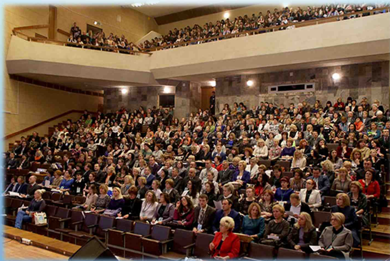
Делегаты IX съезда фармацевтов Беларуси. 2016 год

В апреле 2016 года проведен IX съезд фармацевтов Беларуси на базе Белорусского государственного медицинского университета. В период съезда проведено 2 пленарных заседания и организовано 6 секций. Всего заслушано 45 докладов.